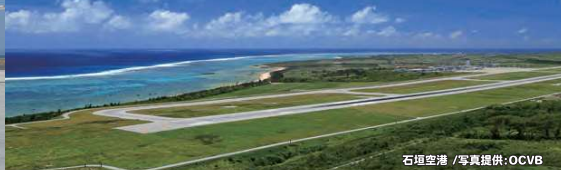
石垣空港